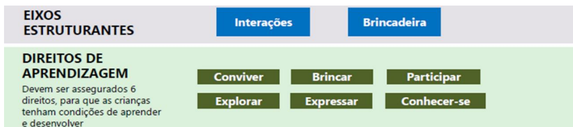
Figura 2: Eixos e Direitos.

“O espaço externo é pequeno também, tem balanço, casinhas de madeira, escorregador e um tablado de madeira com um chuveirão. A sala da direção é na parte de baixo e no segundo andar posiciona-se a cozinha, a lavanderia, banheiro e sala para os educadores.”(E3)