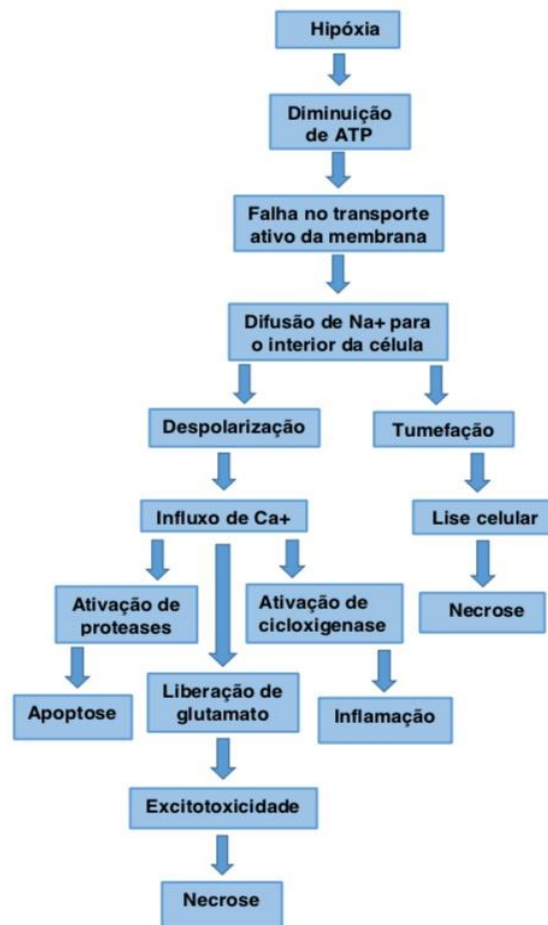
FIGURA 1: fisiopatologia da lesão por hipóxia

A seguir será apresentada figura representando a fisiopatologia da lesão por hipóxia.