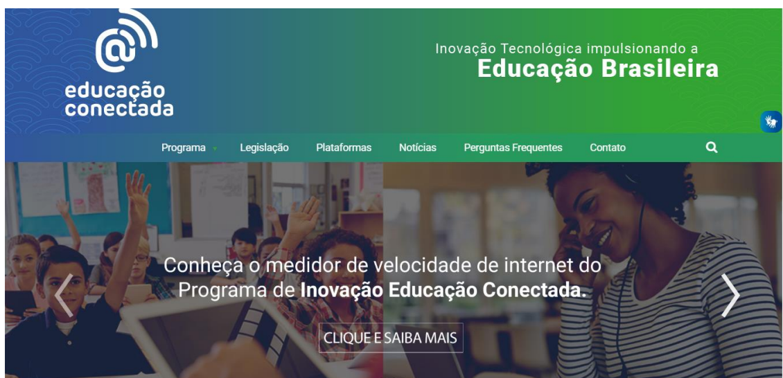
Figura 1: Página Inicial do Programa Educação Conectada.

O mesmo foi dividido em três fases para sua implementação sendo elas: (1) indução (2017 a 2018) para construção e implantação do Programa com metas estabelecidas para alcançar o atendimento de 44,6% dos alunos da educação básica; (2) expansão (2019 a 2021) com a ampliação da meta para 85% dos alunos da educação básica e início da avaliação dos resultados; e (3) sustentabilidade (2022 a 2024) com o alcance de 100% dos alunos da educação básica, transformando o Programa em Política Pública de Inovação e Educação Conectada. Na Figura 1, pode ser visualizada a página online do programa, a qual encaminha o acesso as demais plataformas.