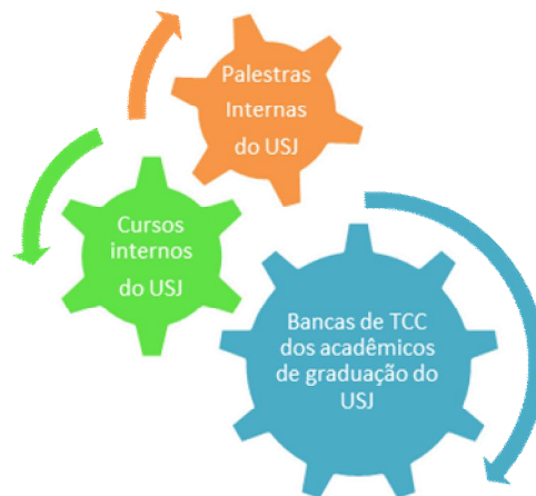
Figura 1: Investimentos na Formação Continuada

Diante desses três depoimentos e buscando nos entrevistados pistas de investimentos na Formação Continuada dos educadores no USJ temos a seguinte engrenagem (figura 1):