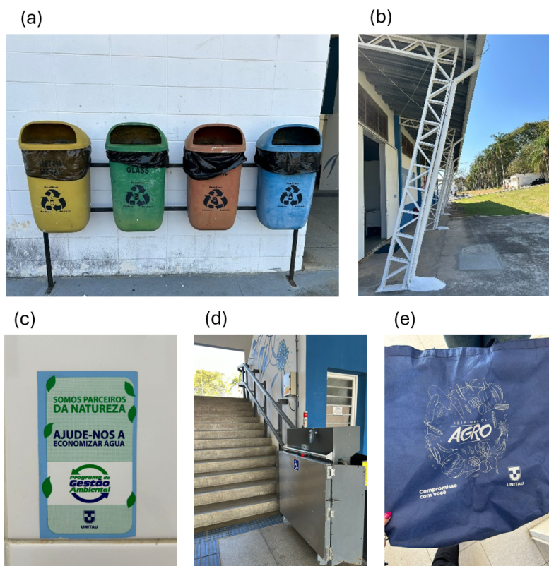
Figura 3 - Práticas ESG observadas no DCA: (a) lixeiras para coleta seletiva, (b) sistema de captação de água da chuva para reuso, (c) placas de sensibilização; (d) medidas de acessibilidade e inclusão; (e) “Sacola Agro”.

Por fim, a governança na instituição, evidenciada pelos diferentes conselhos e comitês, reflete uma estrutura organizacional que valoriza inclusão, transparência e responsabilidade na tomada de decisões. Esses princípios são necessários para garantir a implementação eficaz das práticas ESG, assegurando que as políticas adotadas estejam alinhadas aos valores e objetivos de sustentabilidade da universidade. Além disso, ao incluir diferentes vozes e perspectivas na tomada de decisões, essa estrutura de governança reforça o compromisso com uma educação ambiental que é participativa, crítica e inclusiva, em consonância com os princípios de uma educação não colonizadora. A Figura 3 ilustra algumas das principais práticas ESG observadas no DCA.