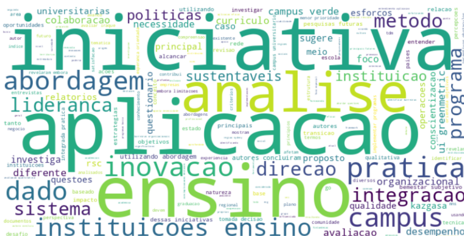
Figura 1 - Nuvem de palavras representativa do corpus global da pesquisa